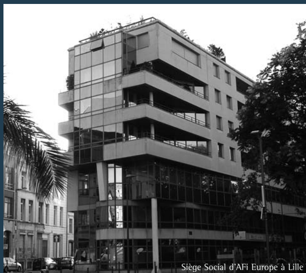
Siège Social d'AFI Europe à Lille